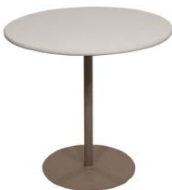
Width: 80 cm